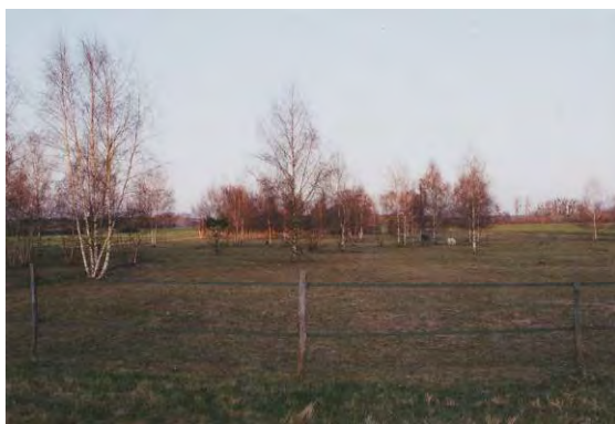
Le terrain en avril 2003