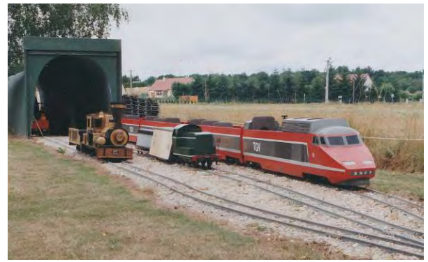
Remontage du tunnel/dépôt et des voies