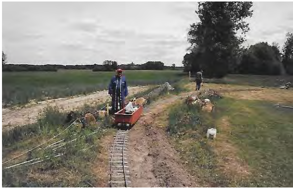
Installation des voies