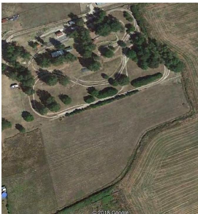
2019 – Achat du 2 ème terrain