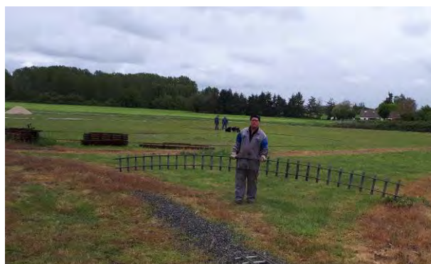
Fabrication et pose des rails