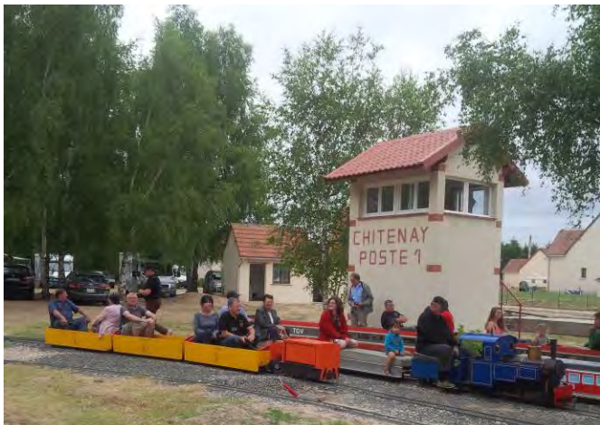
2015 – Construction du poste d'aiguillage