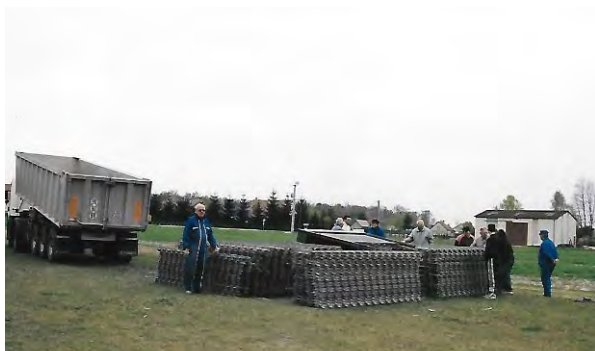
Déchargement des rails et matériels divers