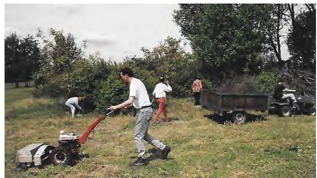
Débroussaillage et préparation du terrain