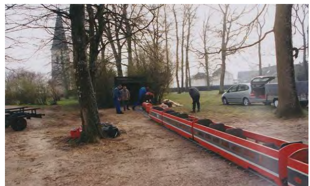
Démontage du réseau au Château de Drouilly