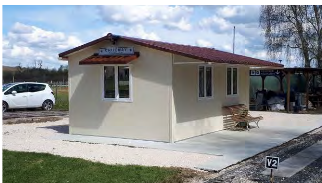
2018 – Le bâtiment de la gare inauguré le 15 août 2018