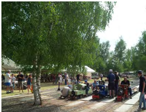
Première Exposition/Bourse en juillet